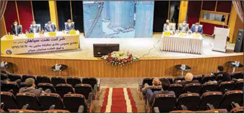
مجمع عمومی عادی سالیانه شرکت بورس کالای ایران در سالن زاری دانشگاه علوم پزشکی برگزار شد.

تولید روغن‌های گروه دو و سه به یکی از قطب‌های تولید روغن پایه تبدیل خواهد شد. در این مجمع پس از بررسی صورت‌های مالی و تصویب آن، ۱۱۰ تومان سود نقدی برای هر سهم در نظر گرفته شد.