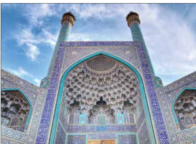
اینفوگرافیک: سید محمدعلی رضوی/اصفهان امروز