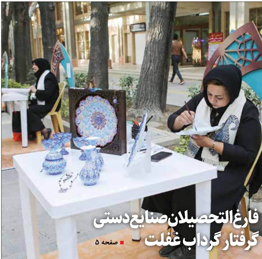
فارغ التحصیلان صنایع دستی گرفتار گرداب غفلت