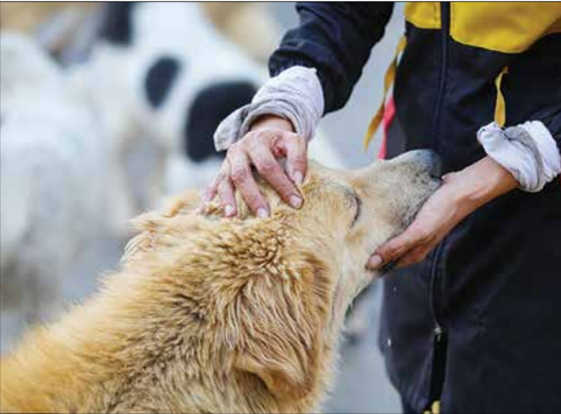
عقیم‌سازی سگ‌های بی‌صاحب در اصفهان